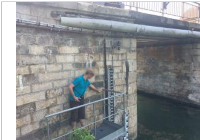
Vue générale de la situation du repère

Altitude calculée de l'eau (en m) : 60.27