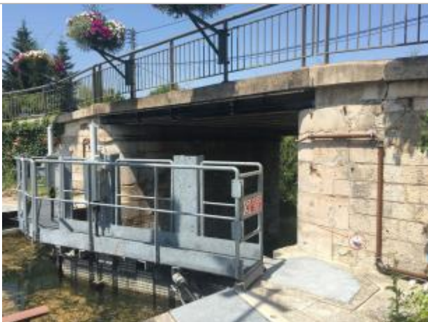
Repère de crue VNF sur la pile de pont à l'aval rive droite de l'écluse

Différence entre le niveau d'eau et la référence (en m) : 0.100 m