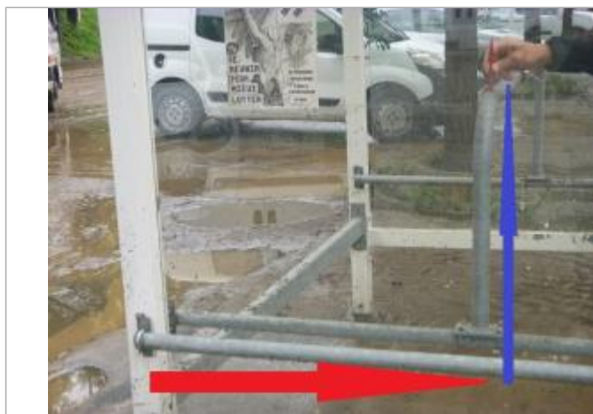
laisse de crues au niveau de l'abri à caddies sur le parking