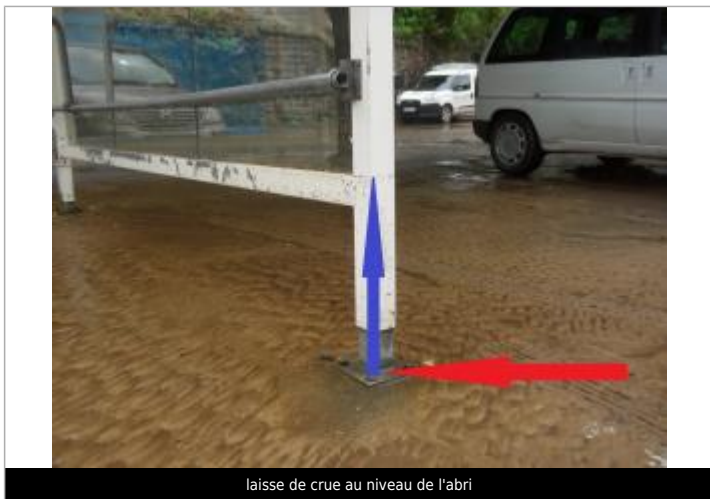
laisse de crue au niveau de l'abri

Altitude calculée de l'eau (en m) : 8.858 m