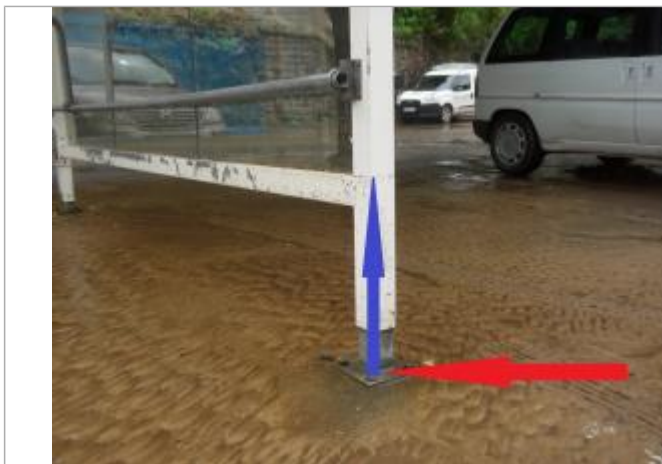
laisse de crue au niveau de l'abri

Altitude calculée de l'eau (en m) : 8.858