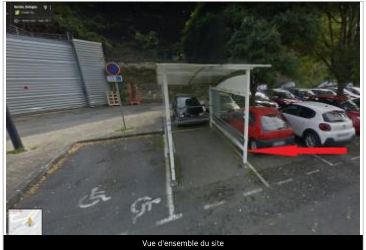
Vue d'ensemble du site