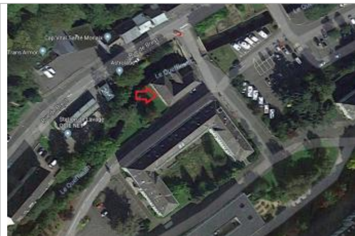
Vue aérienne du site