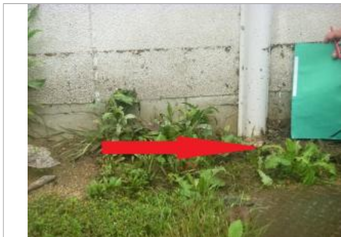
Sol derrière le bâtiment, au niveau de la goulotte

Altitude calculée de l'eau (en m) : 9.54