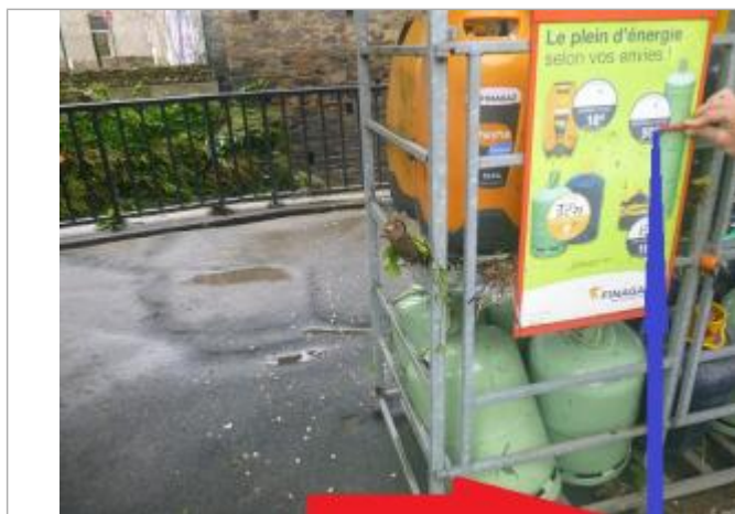
Relevé de la hauteur atteinte indiquée par le crayon

Système altimétrique : NGF IGN 1969 (système normal)