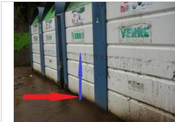
Laisse de crue sur les poubelles

Altitude calculée de l'eau (en m) : 8.82 m