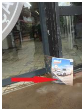
Laisse de crue sur les vitrines à l'entrée du sipermarché

Altitude calculée de l'eau (en m) : 8.81 m