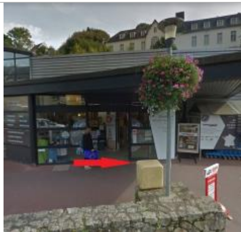
Vue d'ensemble de la façade de la grande surface