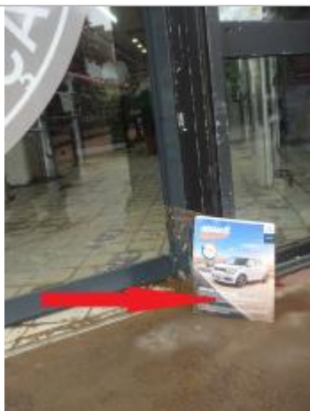
Laisse de crue sur les vitrines à l'entrée du sipermarché

Altitude calculée de l'eau (en m) : 8.81