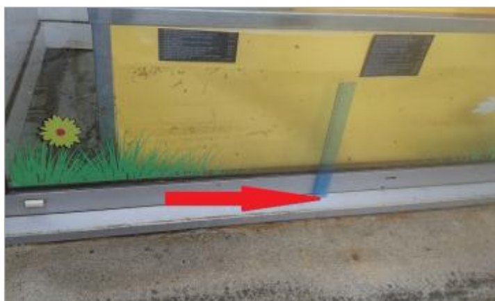
laisse de crue du niveau atteint à l'intérieur du magasin