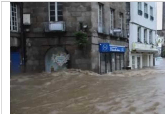
Vue d'ensemble du site lors de l'inondation du 3 juin 2018