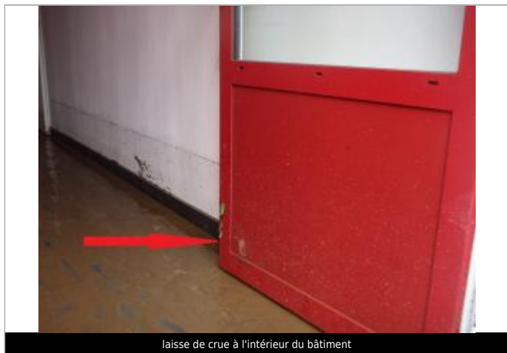
laisse de crue à l'intérieur du bâtiment