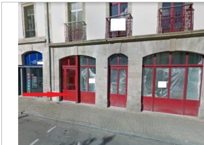
Vue d'ensemble de la façade du bâtiment