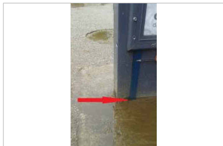
Laisse de crue à l'intérieur de l'arrêt de bus. Le crayon indique le niveau atteint par l'eau.

MARQUE Maximum de l'inondation : Oui Visibilité : Oui État du repère : Moyen Pérennité : Aucune Repère calculé : Non PHEC : Non renseigné