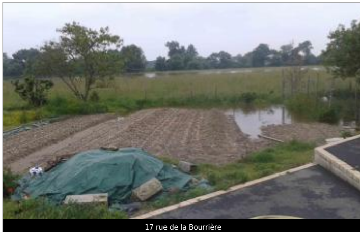
17 rue de la Bourrière