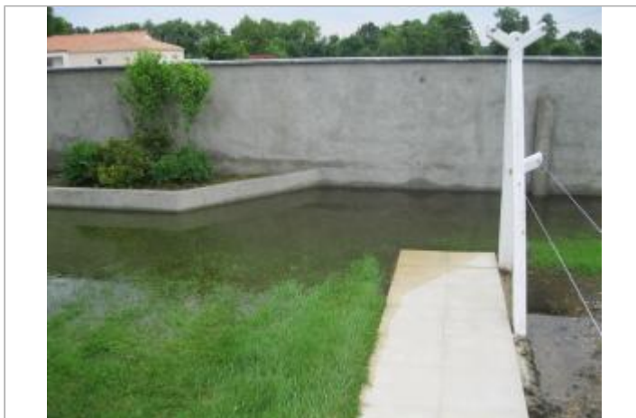
15 rue de la Bourrière