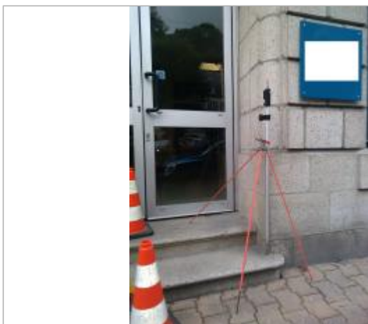
repère à l'extérieur : dessus de la première marche coté droit de l'entrée

Altitude calculée de l'eau (en m) : 5.95 m