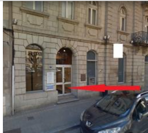
Vue d'ensemble de la façade du bâtiment