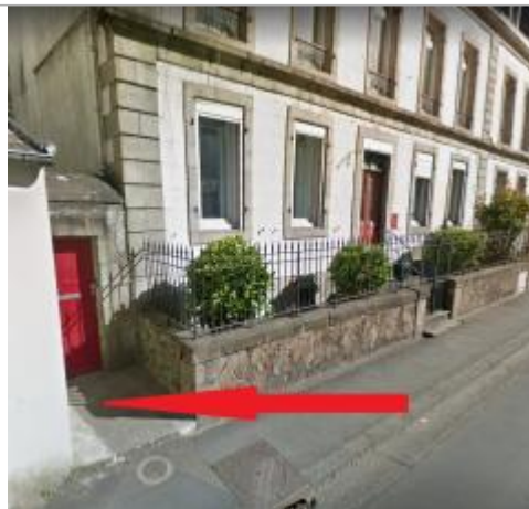
Porte rouge à gauche du n°45 rue de Brest