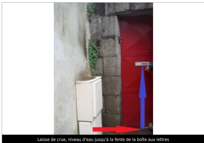
Laisse de crue, niveau d'eau jusqu'à la fente de la boîte aux lettres

Altitude calculée de l'eau (en m) : 8.754 m