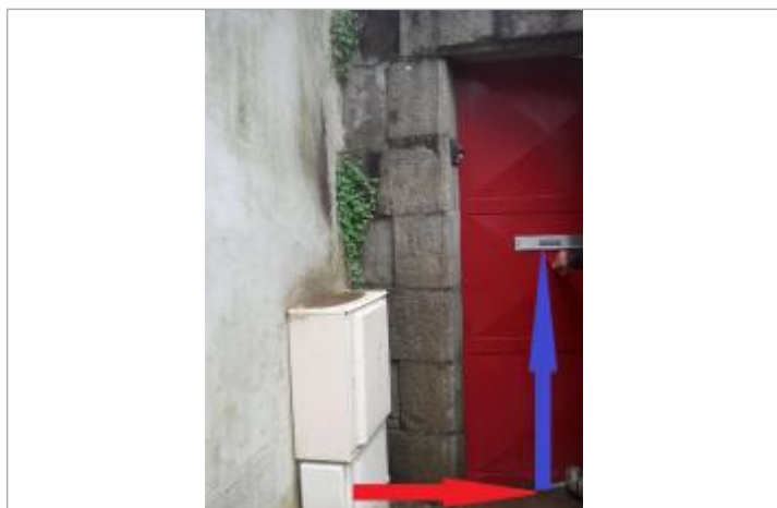
Laisse de crue, niveau d'eau jusqu'à la fente de la boîte aux lettres

Altitude calculée de l'eau (en m) : 8.754