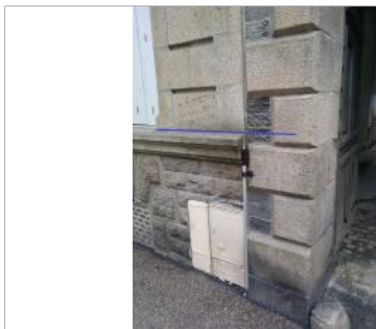
seuil béton du compteur EDF à gauche de l'entrée de la cour

Altitude calculée de l'eau (en m) : 8.715 m