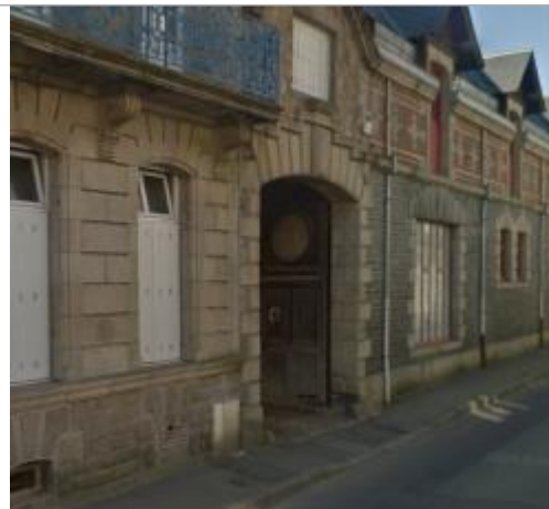
Vue d'ensemble de la façade du bâtiment