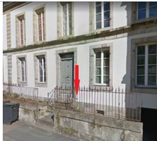
Vue d'ensemble de la façade du bâtiment d'habitation