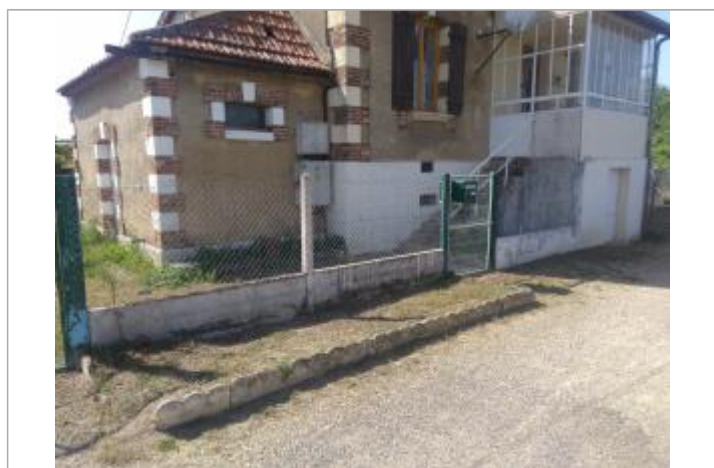
Localisation de l'escalier d'accès

Code : WEB_R_201906262933 Date de mise à jour : 28/01/2020 Auteur : F. Pasquet