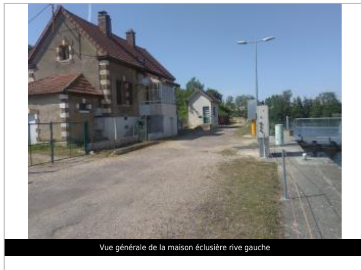
Vue générale de la maison éclésièrè rive gauche