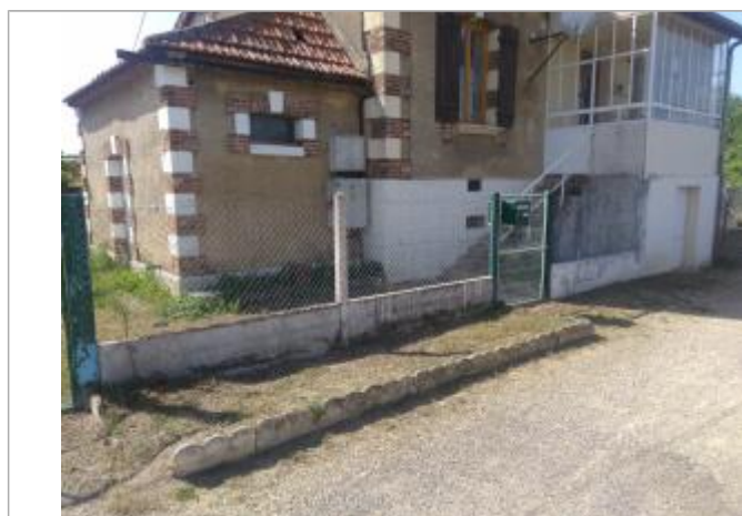
Localisation de l'escalier d'accès