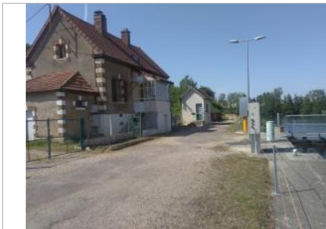
Vue générale de la maison éclésièr rive gauche

Coordonnées WGS84 : X: 3.58019269 / Y: 47.81577780