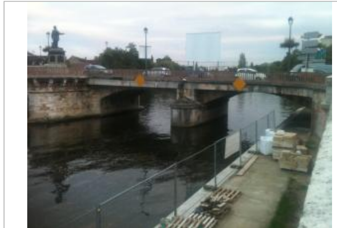
Vue du site - Auteur : Cabinet Schaller-Roth-Simler