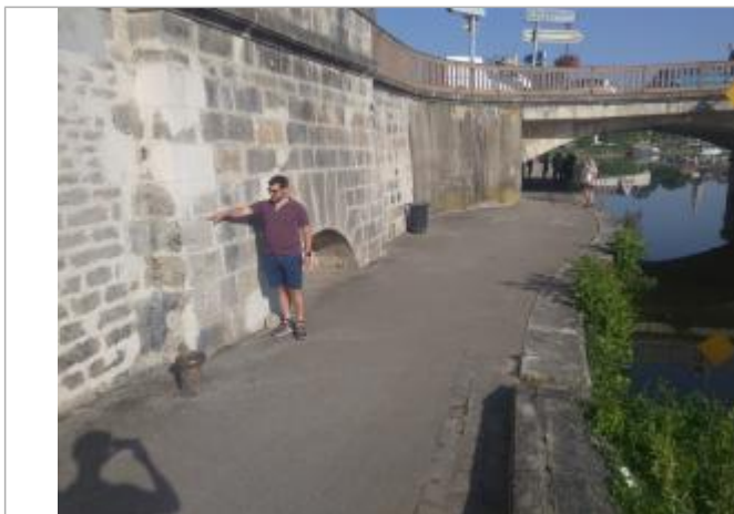
Position du repère en amont rive gauche du pont

Organisme : SPC Seine moyenne - Yonne - Loing