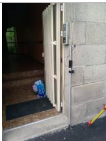
Trottoir à l'angle droit de la porte d'entrée du bâtiment

Altitude calculée de l'eau (en m) : 8.78