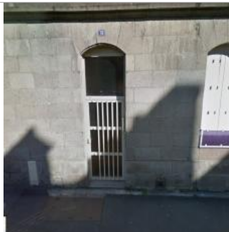
Porte d'entrée de l'habitation