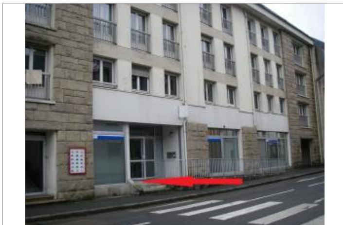
Vue d'ensemble de la façade du bâtiment