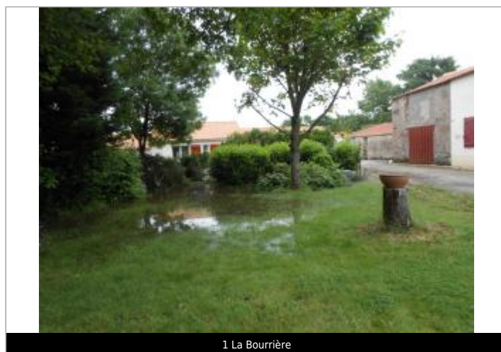
1 La Bourrière

GÉOLOCALISATION Coordonnées WGS84 : X: -1.76045380 / Y: 46.95787130 Coordonnées RGF93 (Lambert 93) X: 338206.96 / Y: 6661760.8 Coordonnées RGF93 (ETRS89) : X: -1.7604538 / Y: 46.9578713