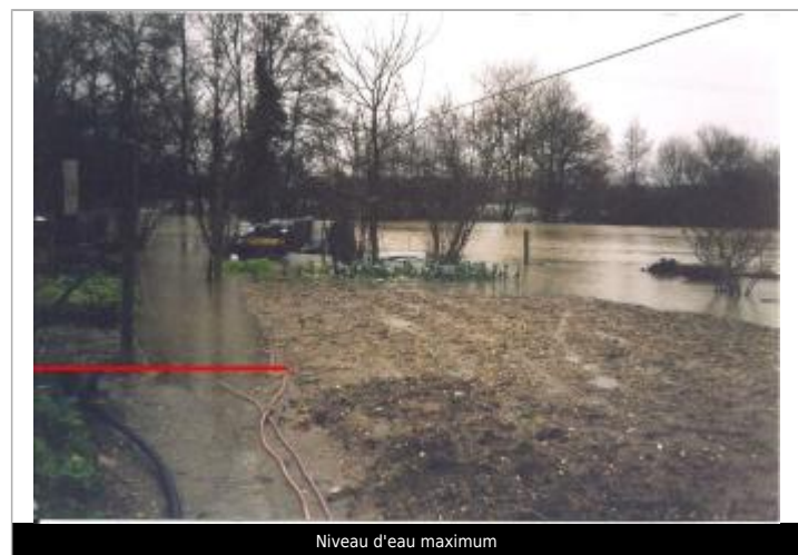
Niveau d'eau maximum

MARQUE Maximum de l'inondation : Oui Visibilité : Non