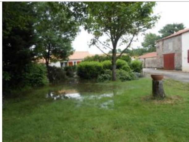
1 La Bourrière