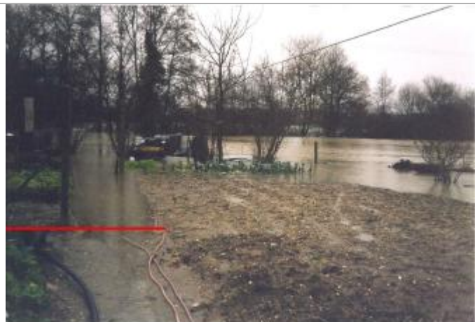
Niveau d'eau maximum