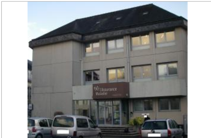
Façade du bâtiment