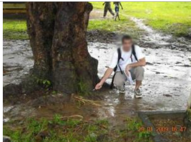
Vue d'ensemble du pont (côté amont)

Coordonnées WGS84 : X: -1.37412680 / Y: 48.00331060