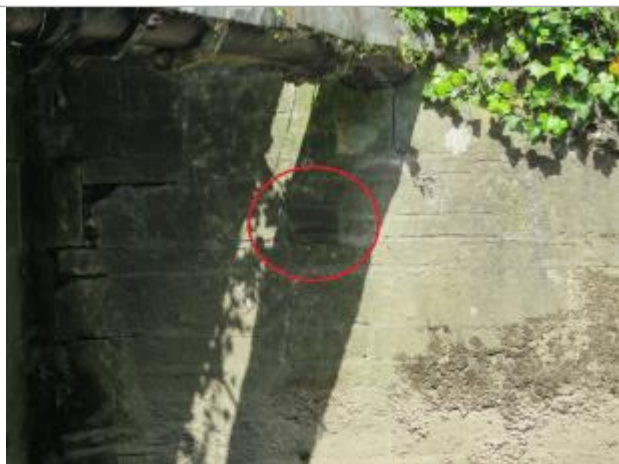
Repère de la crue du 4 janvier 1936

Système altimétrique : NGF IGN 1969 (système normal)