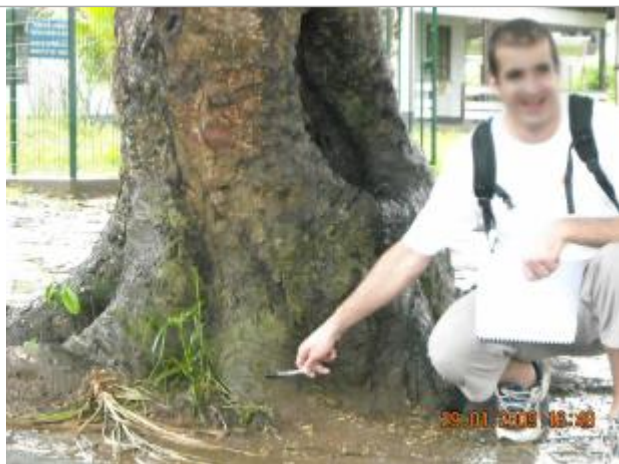
Photographie du repère

Système altimétrique : NGF IGN 1969 (système normal)