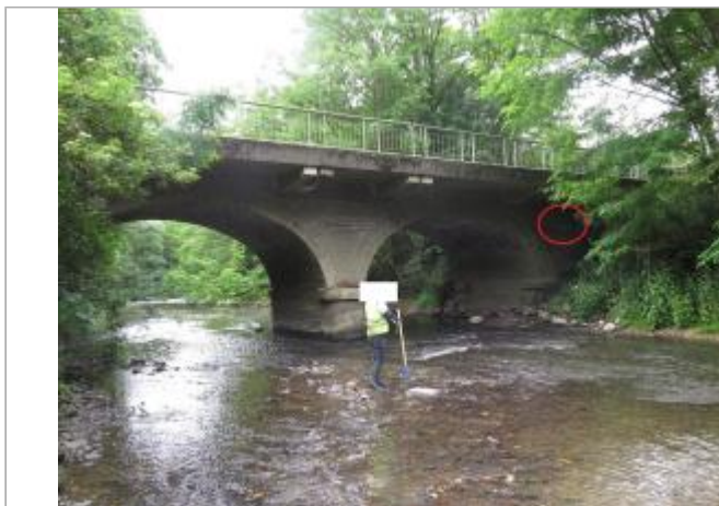
Vue d'ensemble du pont

Coordonnées WGS84 : X: -1.72211800 / Y: 48.02109400