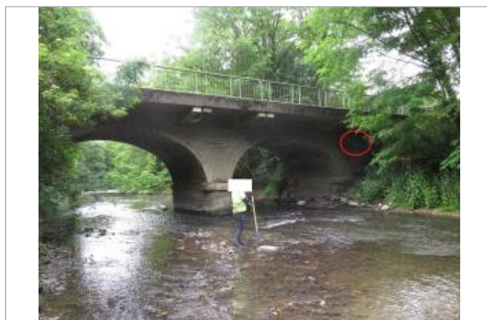
Vue d'ensemble du pont