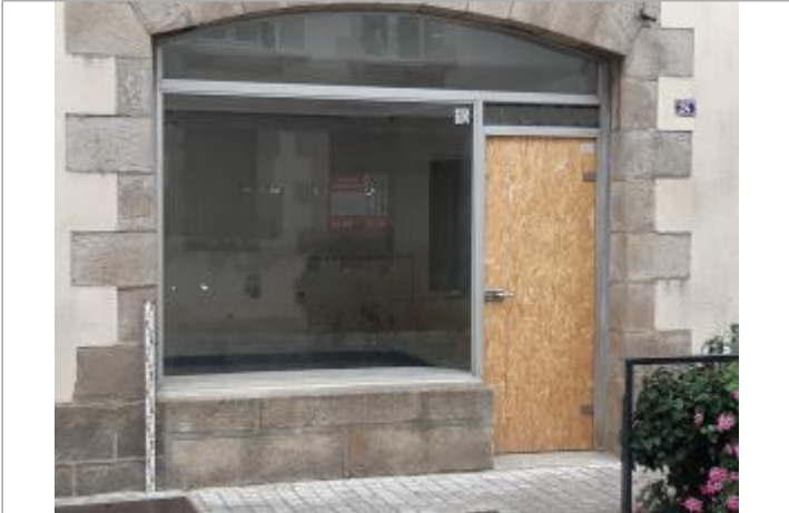
Vitrine du bâtiment 24 rue de Paris