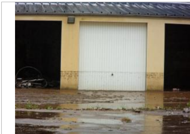
Cour intérieur du bâtiment