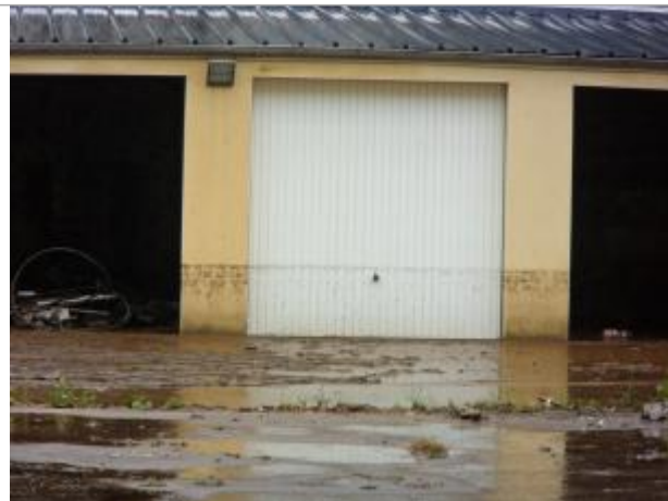
Cour intérieure du bâtiment

Coordonnées WGS84 : X: -3.82382320 / Y: 48.57580900