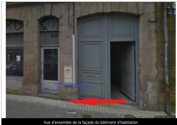
Vue d'ensemble de la façade du bâtiment d'habitation