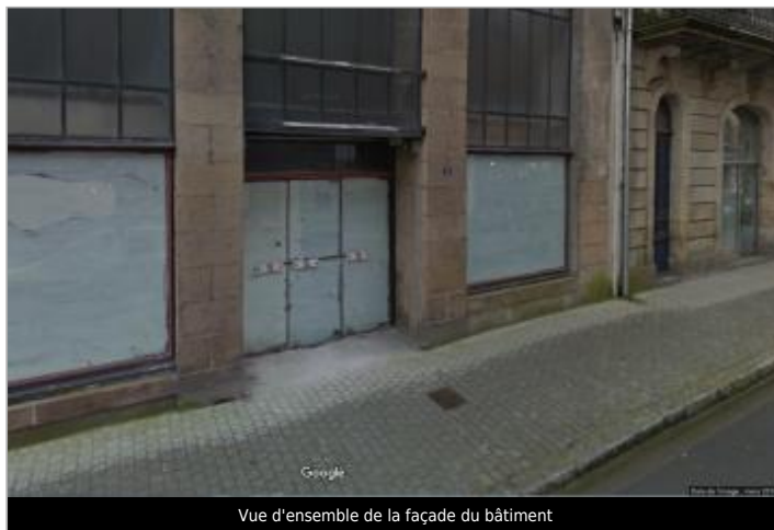
Vue d'ensemble de la façade du bâtiment