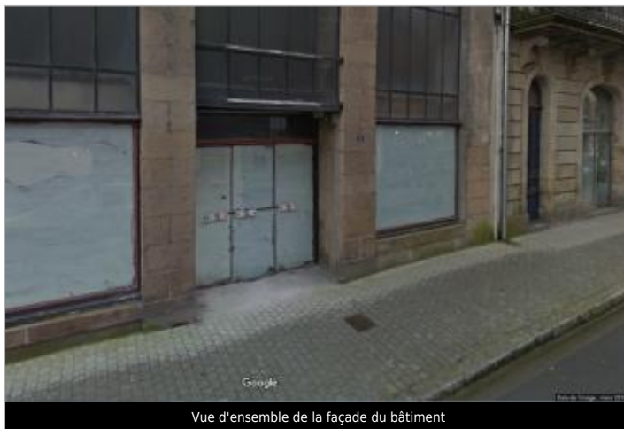
Vue d'ensemble de la façade du bâtiment