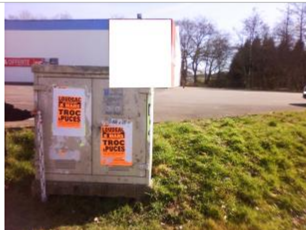
Armoire technique compteur de gaz