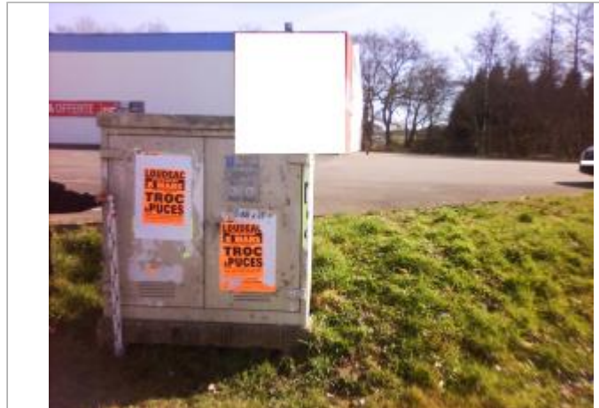
Armoire technique compteur de gaz

Coordonnées WGS84 : X: -2.96016070 / Y: 48.04359140