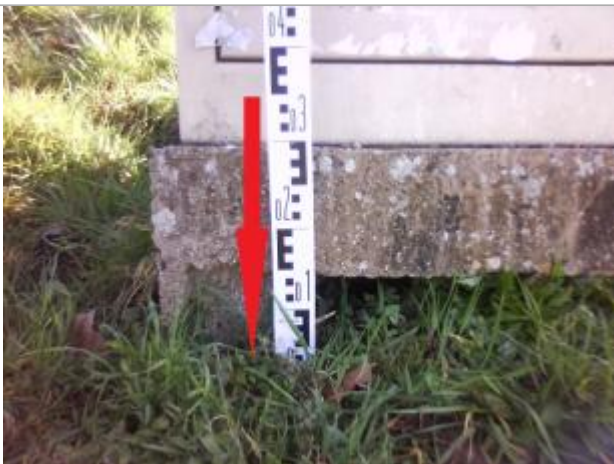
Sol / coin gauche en façade de l'armoire technique

Altitude calculée de l'eau (en m) : 54.32