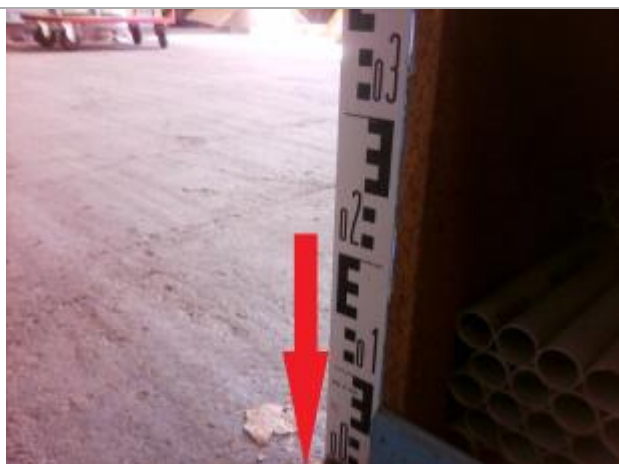
Sol à l'intérieur du hangar

Altitude calculée de l'eau (en m) : 54.1 m