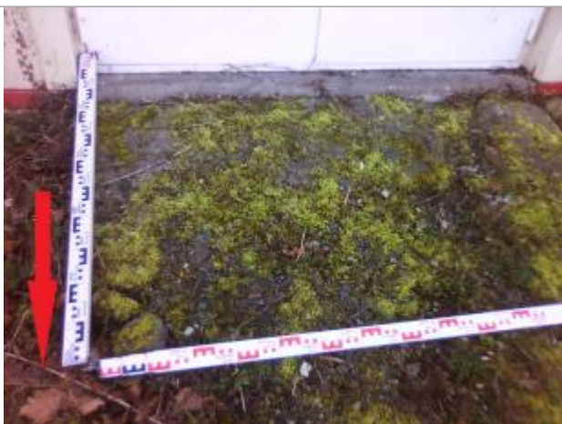
Photographie du repère

Altitude calculée de l'eau (en m) : 54.3