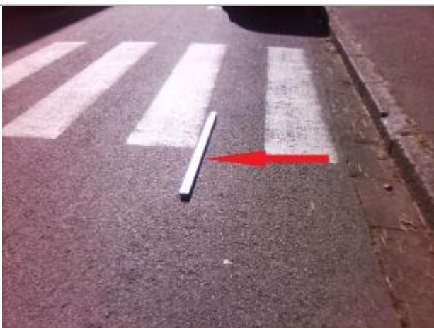
Photographie du repère

Altitude calculée de l'eau (en m) : 55.47 m