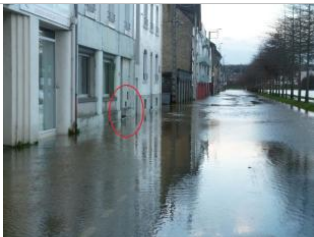
Vue d'ensemble du site lors de l'inondation

Altitude calculée de l'eau (en m) : 55.58