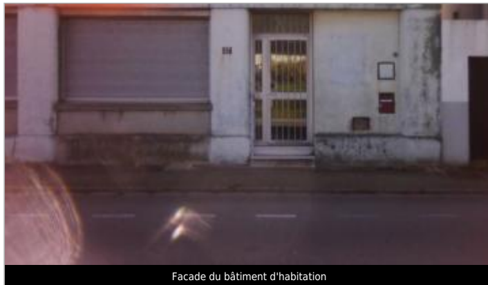
Facade du bâtiment d'habitation