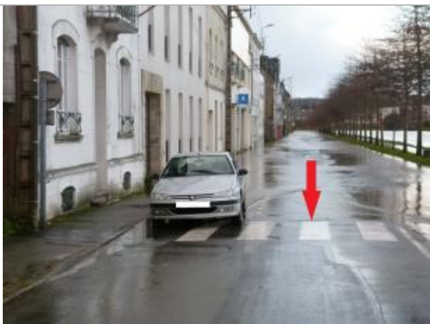
Sol au droit du marquage au sol - passage piéton

Altitude calculée de l'eau (en m) : 55.63 m