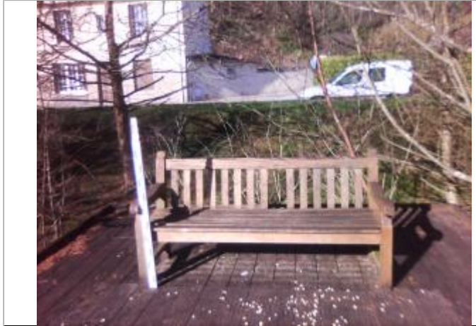
Banc sur promenade le long de la rive du Blavet