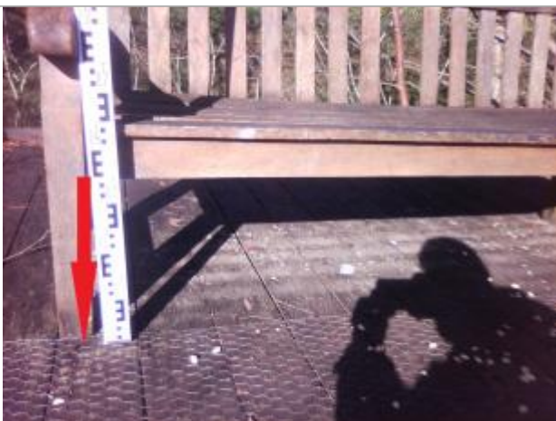
Sol au droit du banc

Altitude calculée de l'eau (en m) : 55.57 m