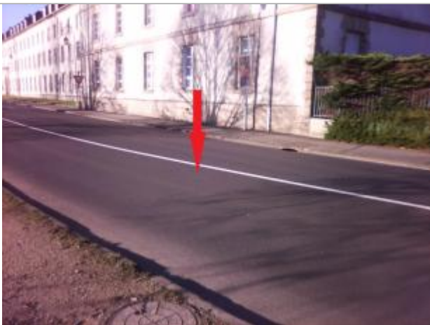
Photographie du repère

Altitude calculée de l'eau (en m) : 55.73 m