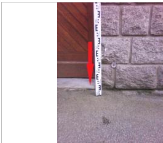
Seuil de la porte d'entrée de l'habitation