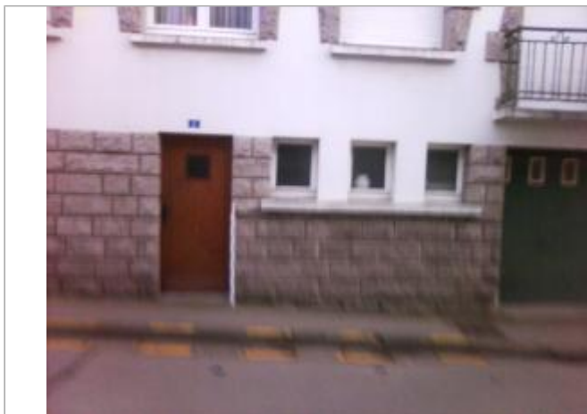
Facade du bâtiment d'habitation

Coordonnées WGS84 : X: -2.96879050 / Y: 48.06896810