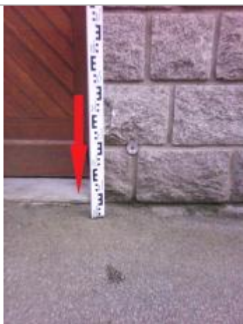
Seuil de la porte d'entrée de l'habitation