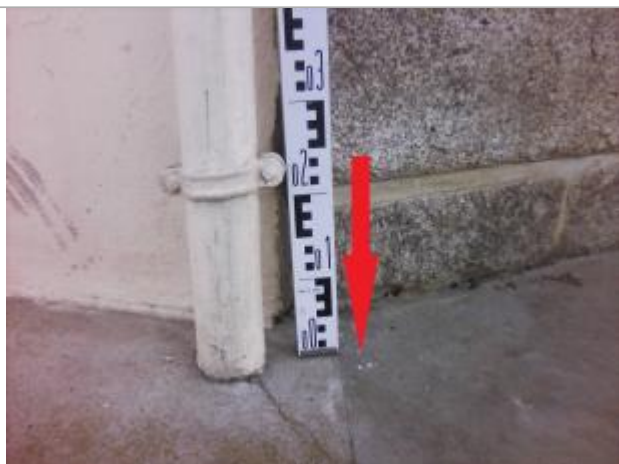
Sol au pied de la maison (sur le trottoir) à l'angle du bâtiment (rue de la Fontaine et ruelle du chêne)

Altitude calculée de l'eau (en m) : 55.82