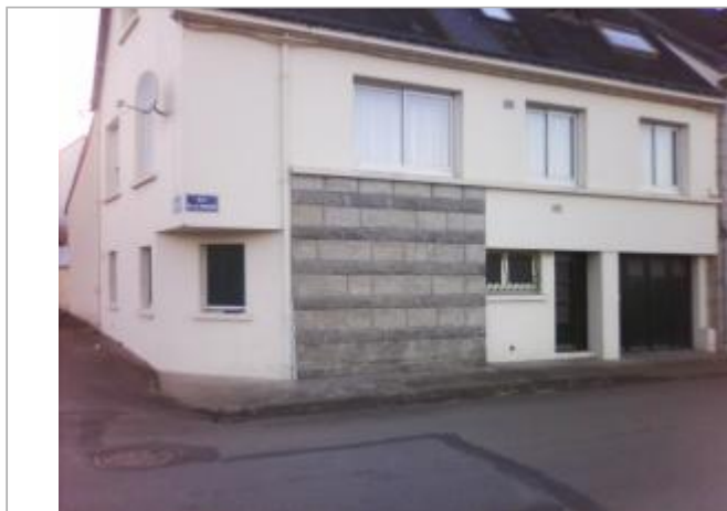
Facade du bâtiment d'habitation