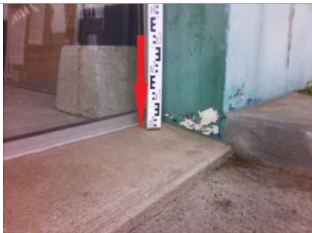
Sol du côté droit du seuil de la porte du garage

Altitude calculée de l'eau (en m) : 56.03