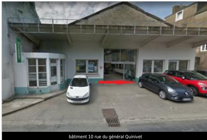
bâtiment 10 rue du général Quinivet

Coordonnées WGS84 : X: -2.96898580 / Y: 48.06918800