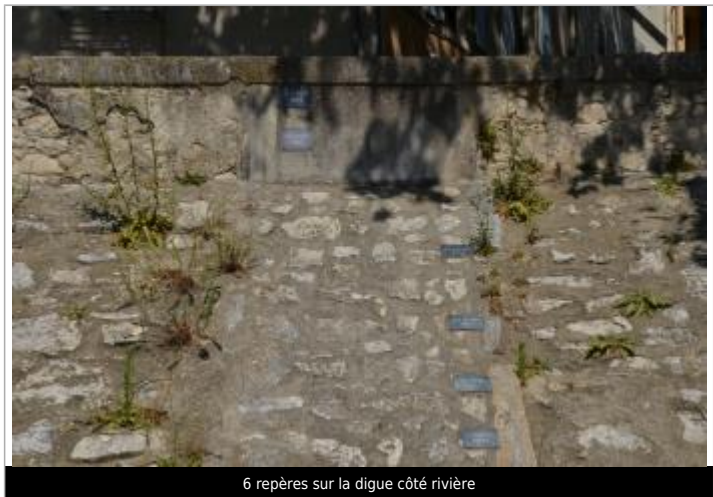
6 repères sur la digue côté rivière

MARQUE Texte : 1 OCT 1993 Visibilité : Oui État du repère : Bon