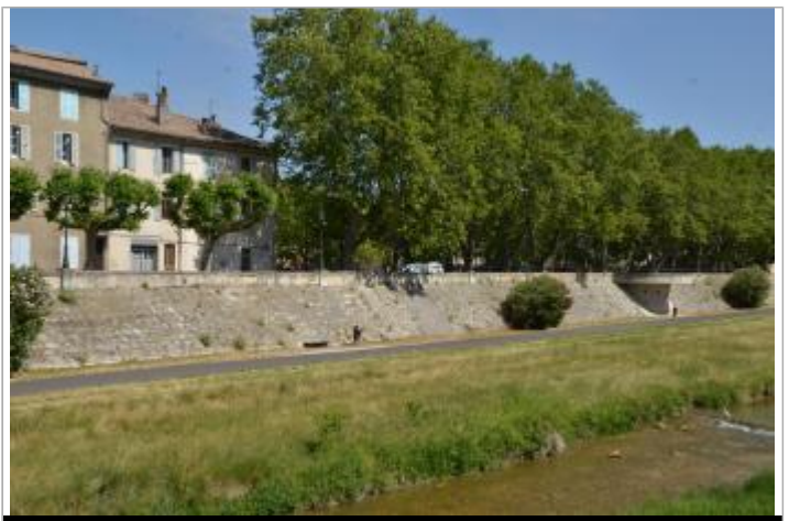
Vue générale du site, les repères sont sur le parement de la digue.

GÉOLOCALISATION Coordonnées WGS84 : X: 4.75207480 / Y: 44.55510900 Coordonnées RGF93 (Lambert 93) : X: 839147.44 / Y: 6385547.48 Coordonnées RGF93 (ETRS89) : X: 4.7520748 / Y: 44.555109 Code Hydro: V44-0400 Rive de référence: