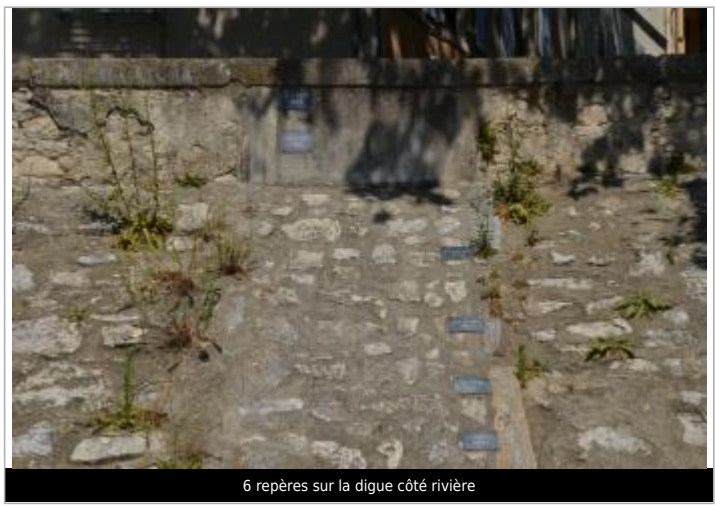
6 repères sur la digue côté rivière

MARQUE Texte : 22 JUILLET 1914 Visibilité : Oui État du repère : Bon