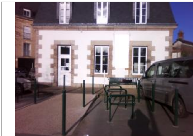
Devanture du bâtiment de commerce