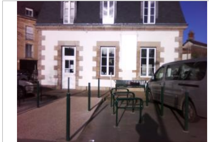
Devanture du bâtiment de commerce

Coordonnées WGS84 : X: -2.96819060 / Y: 48.06739680