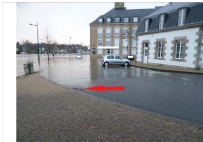
Sol au pied du trottoir

Altitude calculée de l'eau (en m) : 55.75