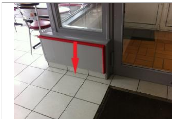
Plancher à l'intérieur du magasin

SOURCE DE REPÉRAGE : CAMPAGNE DE TERRAIN DHE 2015 - 26/02/2015