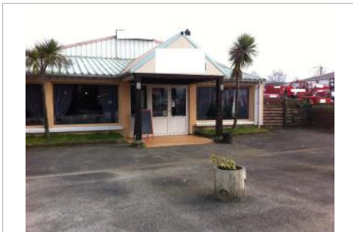
Facade du restaurant

Coordonnées WGS84 : X: -2.95935010 / Y: 48.04292700