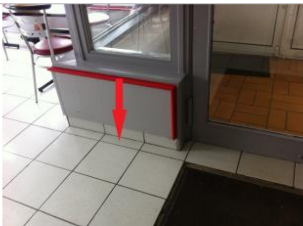
Plancher à l'intérieur du magasin

Altitude calculée de l'eau (en m) : 55.01 m